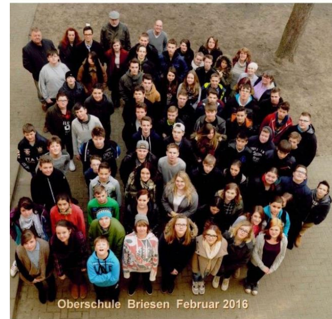
Oberschule Briesen Februar 2016

Ein INISEK-Projekt an der Oberschule Briesen der FAW gGmbH